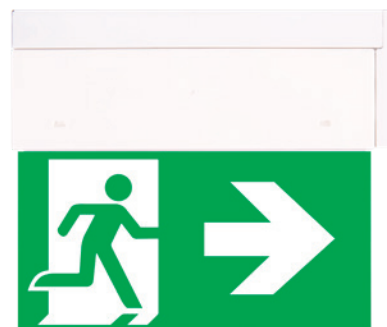
DIRECTO wersja z uchwytem flagowym / with flag mounting bracket