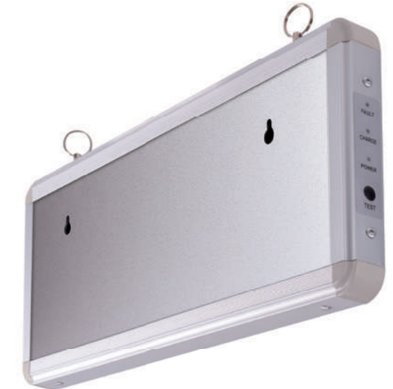
Punto Wall (back)