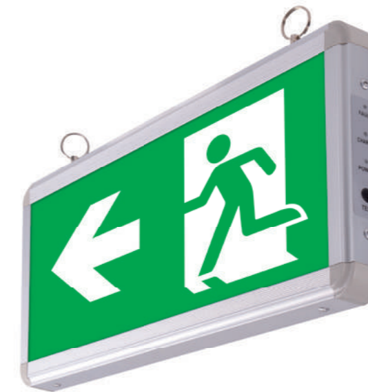
Punto (Double & Wall)