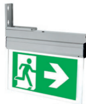
Wspornik flagowy / Flag mounting bracket