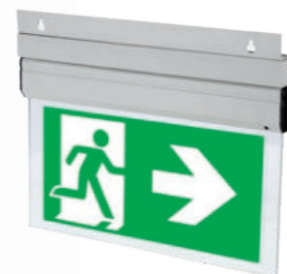
Wspornik ścienny / Wall mounting bracket