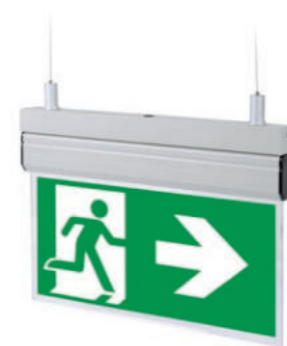
Zestaw do montażu zwieszanego / Suspended mounting kit