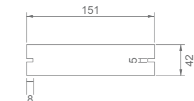
widok spodu / bottom view