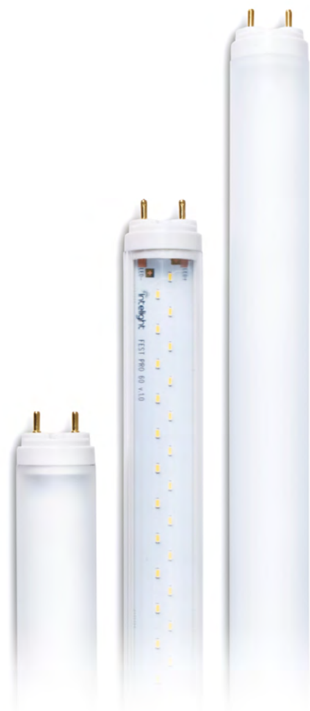
Fest Pro LED