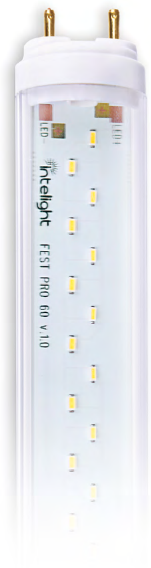
Fest Pro LED